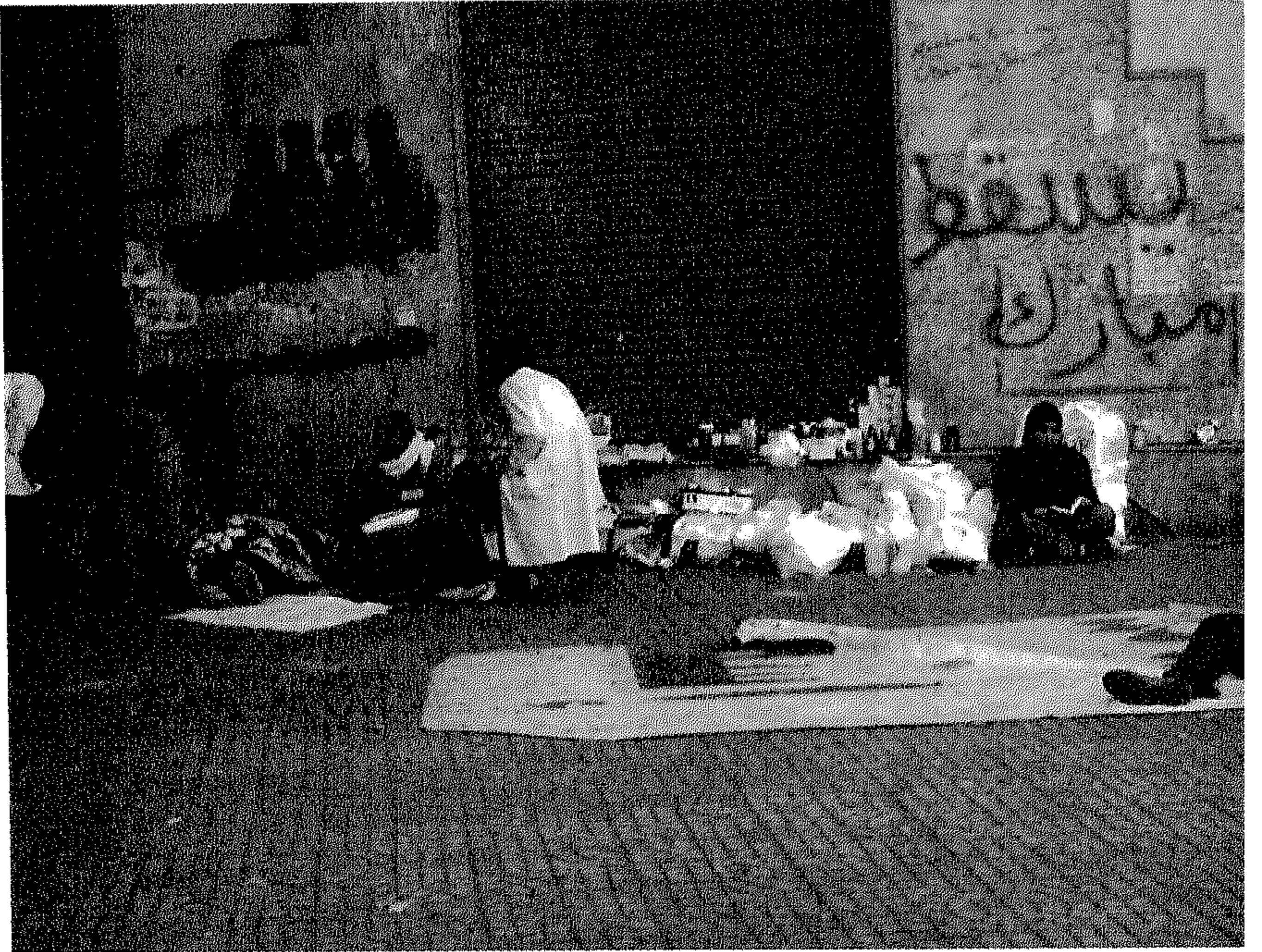
وحدة طبية خارجية في ميدان التحرير في أول يوم إنشائها، الوحدة رقم 1